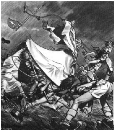
Bivouac sous le vent, dessin de Pierre Joubert (voir Info~Troupe n°5)

Evidemment, ce ne sont que quelques conseils, et rien ne vaut l'expérience du vécu pour apprendre à camper.