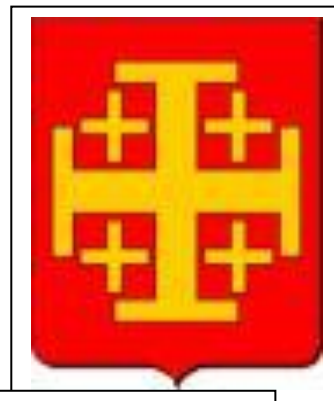
Baudouin et la croix potencée (voir biographie)